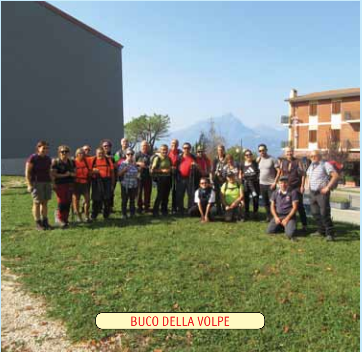
BUCO DELLA VOLPE